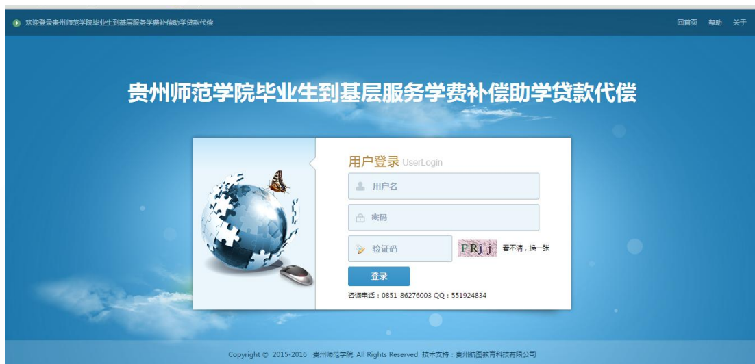
图 5 登陆界面