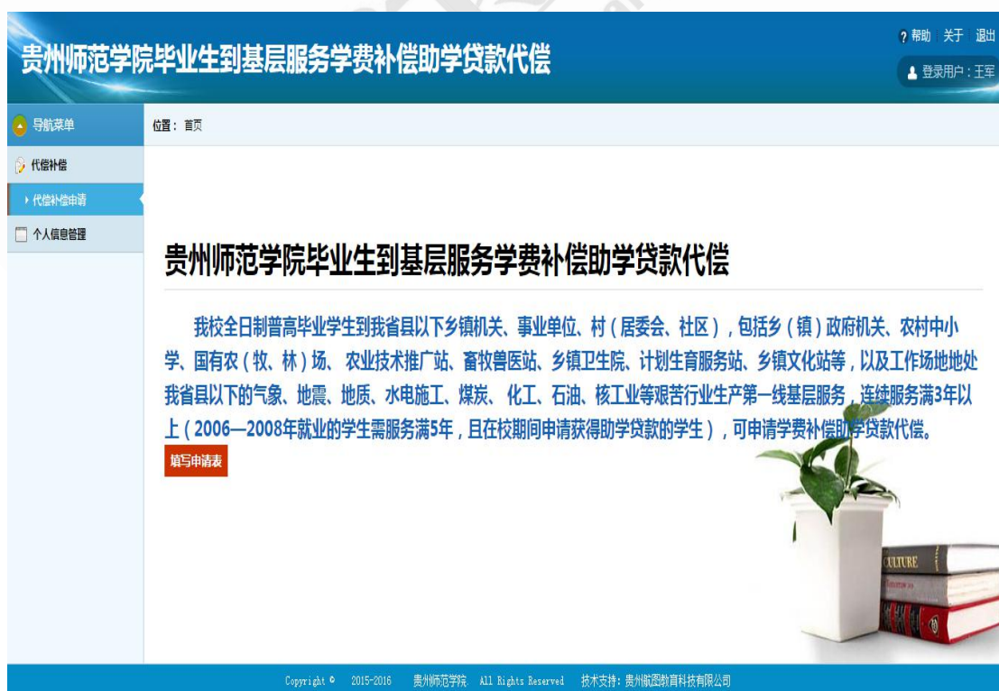
图 8 系统首页

2、 11 级及 11 级以后的同学登陆 ，登陆账号为身份证号码，密码为学号，并且 11 级以后的同学的登陆账号密码与 贵州师范学院学生资助管理平台 的登陆账号密码一致，如果在资助管理平台修改过密码的同学请以修改过的为准。登陆成功后就直接进入系统首页，如图 8。