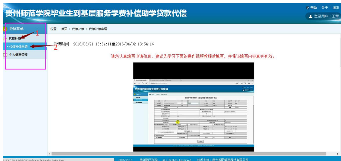
图 11 进入申请表页面