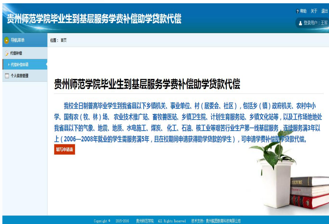
图 7 系统首页

2、 11 级及 11 级以后的同学登陆 ，登陆账号为身份证号码，密码为学号，并且 11 级以后的同学的登陆账号密码与 贵州师范学院学生资助管理平台 的登陆账号密码一致，如果在资助管理平台修改过密码的同学请以修改过的为准。登陆成功后就直接进入系统首页，如图 8。