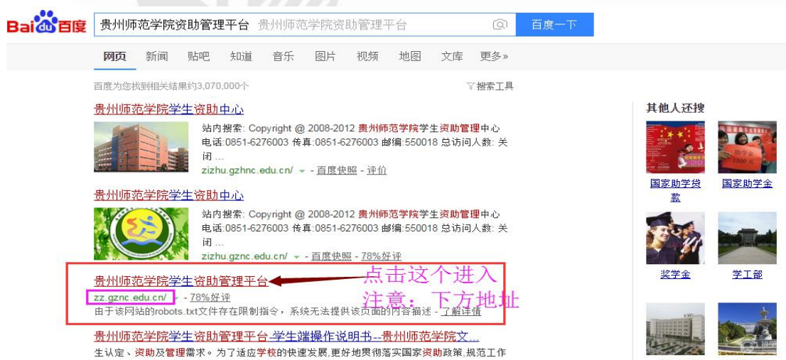
图 2 搜索进入系统

2、在百度搜索中搜索关键词“贵州师范学院资助管理平台”，在出现的搜索结果中选择“贵州师范学院学生资助管理平台”点击并进入，如图 2：