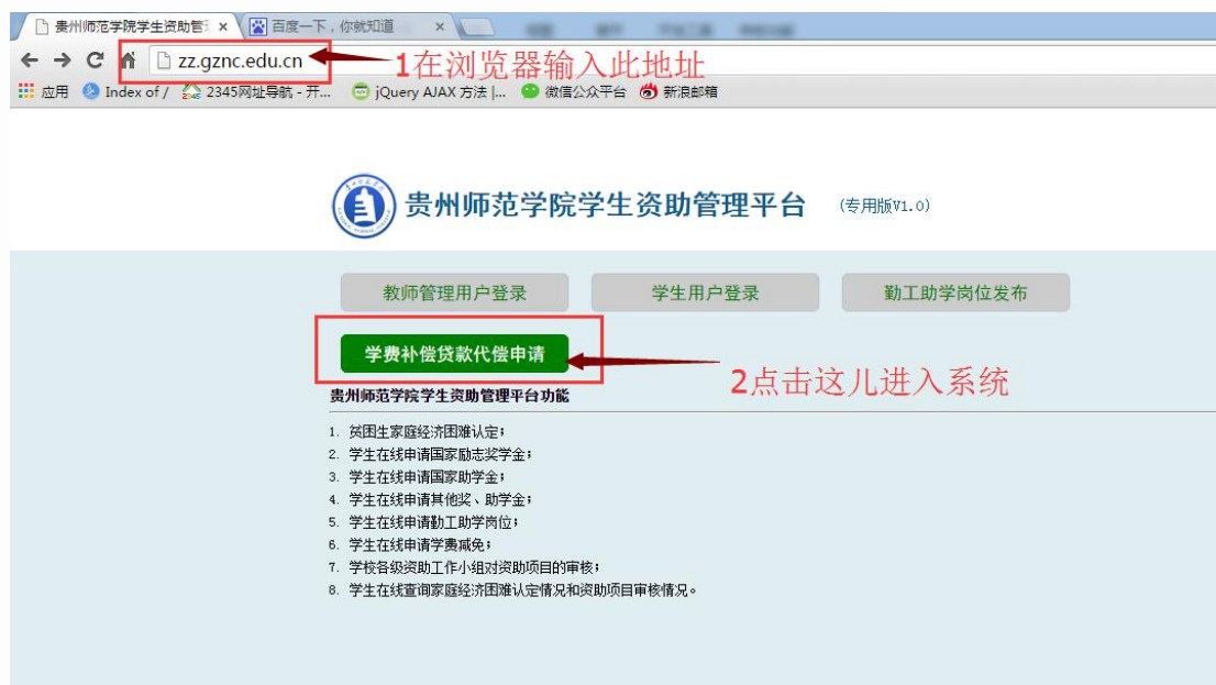
图 1 用地址直接登陆

1、直接输入系统入口地址： http://zz.gznc.edu.cn/ ，并在打开页面上选择“学费补偿贷款代偿申请”按钮，即可进入，如图 1， 建议使用此方式 ：